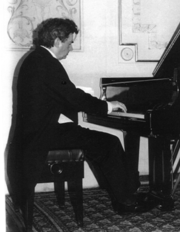
Foto al piano, realizada en la “Sociedad INT, Chopin, Palacio Ostrogski, Varsovia, 1999”

Su atención hacia la realidad interpretativa de las obras y al ideal sonoro de épocas pretéritas le ha impulsado a la recuperación de instrumentos históricos ocasionalmente con el patrocinio de la UNESCO y otras Fundaciones. Definido por Federico Sopeña como “el más original de los pianistas actuales”, entre otros juicios críticos pueden citarse: